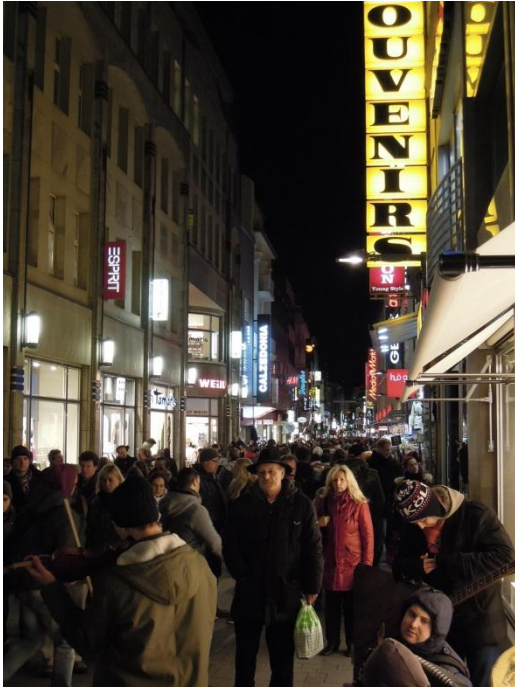
Blick auf die heutige Hohe Straße in Köln.

Straße. Über die heutige Hohe Straße zu laufen ist wahrlich kein Genuss. Schön war es da zur Zeit der Römer. Die »cardo maximus«, so hieß die Hohe Straße damals, war 5x so breit wie die heutige Straße. Links und rechts wurde Sie von Galerien gesäumt, welche die Römer vor Regen oder Sonneneinstrahlung schützten.