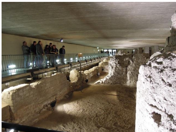
Die Gruppe vor den Überresten des römischen Stadthalterpalastes.

Weiter geht es zu den Überresten des Stadthalterpalastes. Zur Zeit der Römer waren die Stadthalter, die Stellvertreter des römischen Kaisers. Anhand eines Bildes, erläutert Fr. Priebe, die einzelnen Bauabschnitte des Palastes. »Sie dürfen jetzt alle gleich Baumeister spielen, die