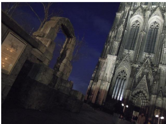
Einer der Seiteneingänge des Nordtores.