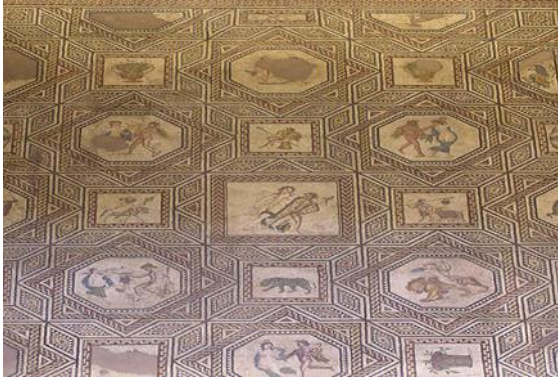
Abbildung des „Dionysosmosaik“ im Römisch-Germanischen Museum.

Römerzeit strahlen uns entgegen. Sie lenkt den Blick der Gruppe in die Tiefe. Die Ingenieure sehen ein riesiges römisches Mosaik, das »Dionysosmosaik«. Zuerst vermuteten die Archäologen, wegen den verschiedenen Abbildungen von Muscheln, Tieren und Lebensmitteln, dass es sich um den