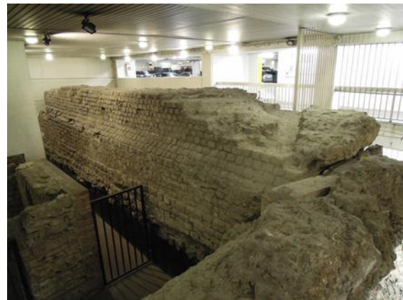
Blick auf die Überreste des Nordtores in der Dom Tiefgarage.

besten Betons der heutigen Welt verwendet haben, hätten Sie nicht gedacht. 400 Jahre beschützte diese Mauer die Römer und weitere 700 Jahre fanden die Menschen des Mittelalters Schutz dahinter. Ob eines unserer heutigen Bauwerke über 1100 Jahre Stand halten würde, muss sich erst noch zeigen. Komische Blicke aus vorbeifahrenden Autos verfolgen die Gruppe auf ihrem weiteren Weg durch die Tiefgarage. Die Leute fragen sich wohl was die ganzen Menschen hier machen. Auf dem Weg an die Oberfläche, bemerken zwei Ingenieure mit neckischen Blick, dass es wohl besser ist, in Köln nicht zu buddeln, wer weiß was man dann noch alles findet. Köln wurde im zweiten Weltkrieg zu 90 % zerstört. Beim Wiederaufbau in den 50igern, fanden die Leute viele historische Bauwerke. Es gab