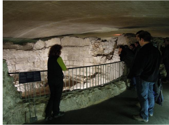
Überreste einer runden Halle im Stadthalterpalast..